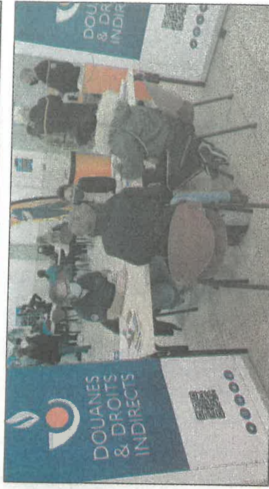
Le service des Douanes était présent pour la première fois.