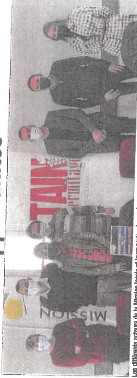
Les différents acteurs de la Mission locale et leurs partenaires unis autour de l'organisation du forum.

Sans compter que la sécurité privée évolue, se professionnalise et recrute des agents pour assurer la sécurité et la protection des biens et des personnes.