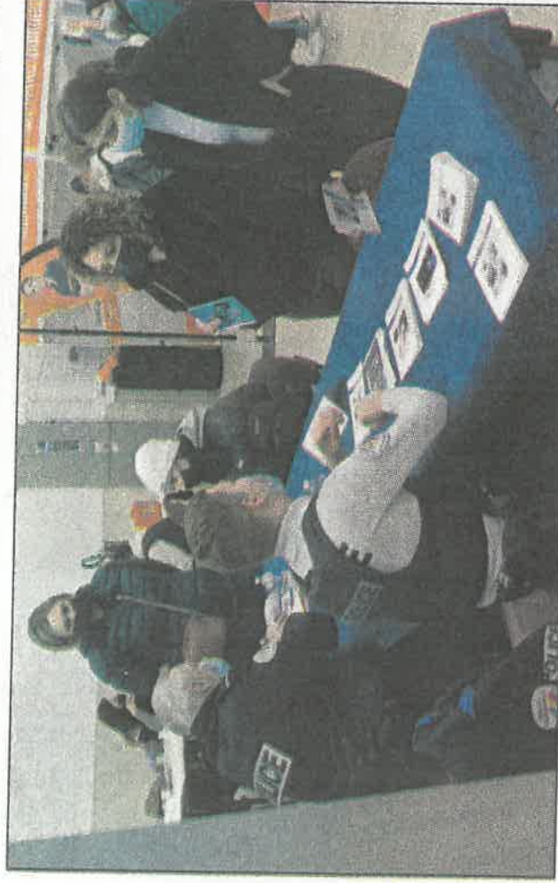
Le stand de la Police a rencontré un certain succès.