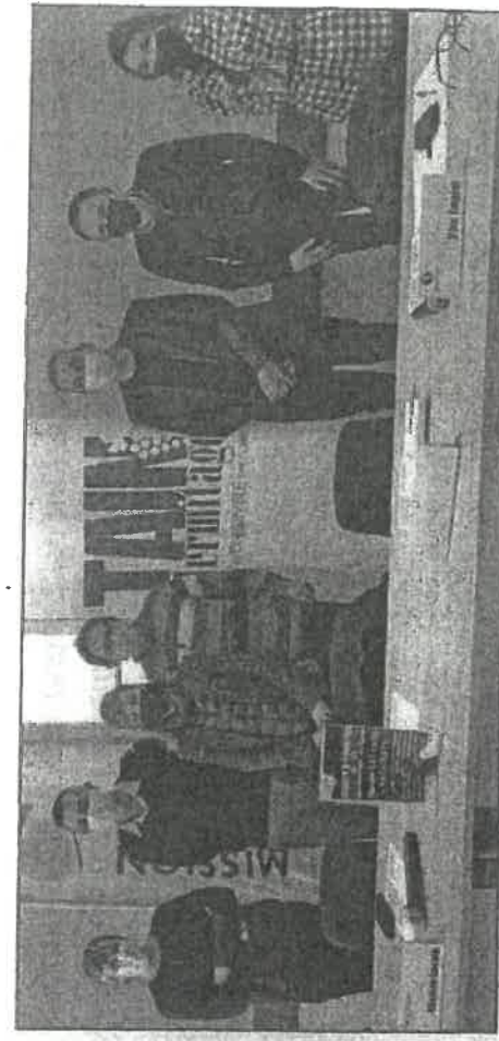
Le 16 février, un forum où des partenaires s'investissent. (photo DR).

Le secteur de la sécurité privée est aussi, depuis quelques années, en pleine évolution et se professionnalise. Ce secteur propose et recrute de nombreux métiers : Agent de sécurité, tuteur, surveillance, protection des biens