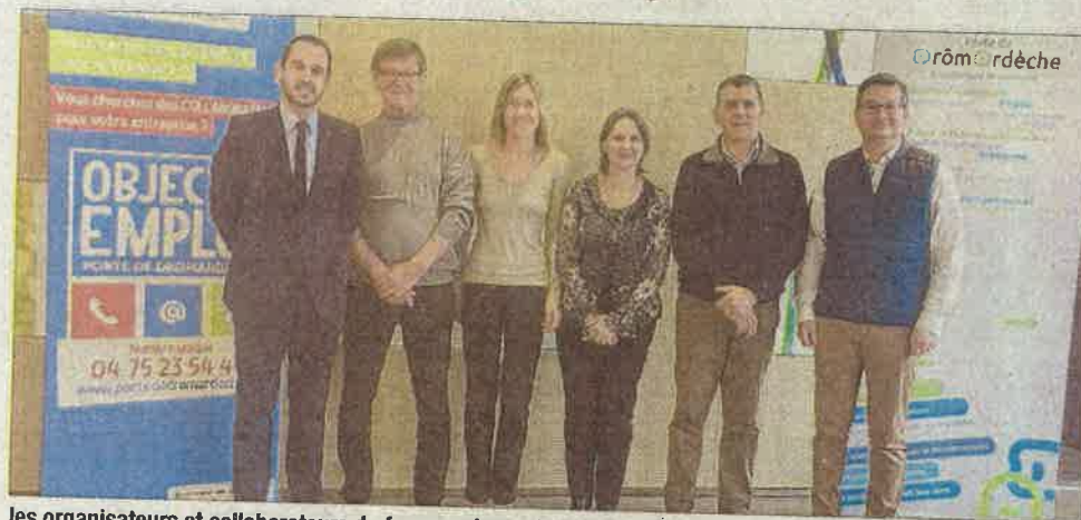
les organisateurs et collaborateurs du forum qui aura lieu le 11 avril.

Les secteurs de l'industrie, du commerce, de la vente et de la grande distribution seront les plus représentés notamment avec Bert, Eymin Leydier, Jars, Trotec, Intermarché et la biscuiterie d'Albon suivis par les organismes de formation, tels que le lycée polyvalent Henri Laurens ou encore le Valentin. Les services à la personne et les organismes institutionnels seront aussi présents, chambre de mé-