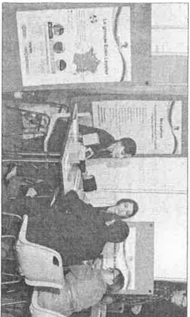
L'occasion de rencontrer les entreprises qui embauchent.