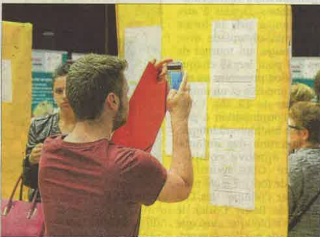
Environ 50 annonces de Pôle emploi étaient mises en avant, dans des filières aussi variées que les entreprises présentes : commerce, restauration, communication, bâtiment, etc. LeDLJ/P.