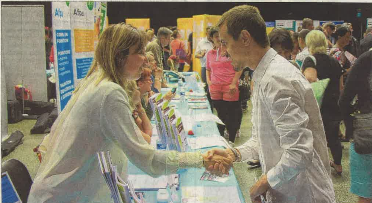
Les représentants de plusieurs écoles proposant des formations en alternance ont mis en évidence les différentes filières, du CAP au BTS, en passant par les bacs professionnels ou les contrats de professionnalisation. LeDLJ/P.

90 Soit le nombre d'offres qui ont été présentées pendant le forum. 40 d'entre elles étaient en recrutement direct. C'est-à-dire avec un entretien auprès du représentant de l'une des 18 entreprises concernées. Les cinquante autres offres étaient mises à disposition par Pôle emploi sur des panneaux d'affichage. Selon la Mission locale, pour le même nombre d'offres en 2015, 63 avaient trouvé preneur. Un chiffre stable depuis le lancement du forum.