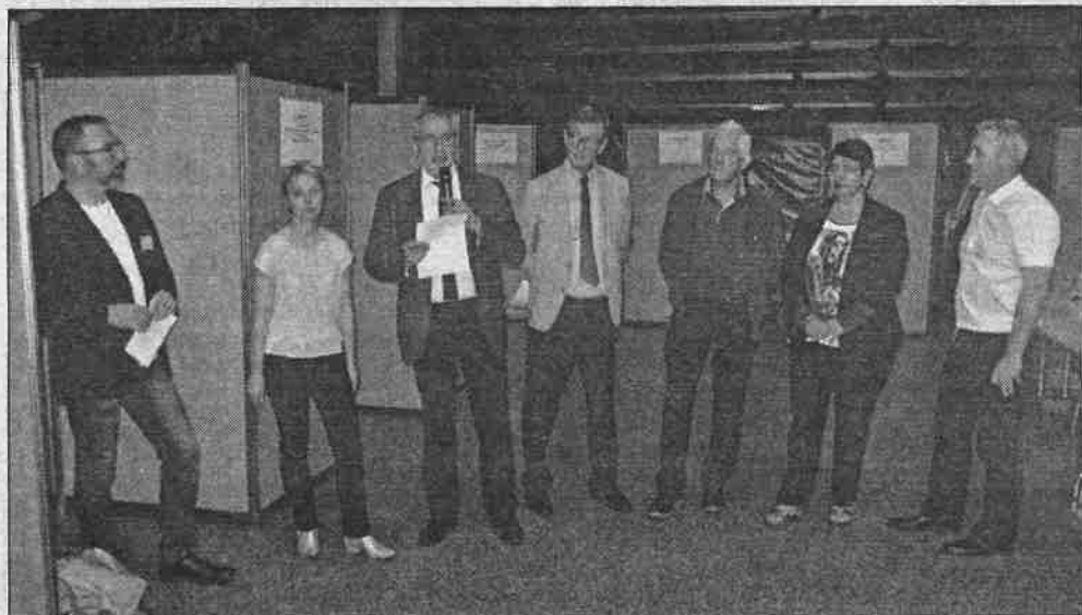
L'ouverture par les présidents.

Organisé le mercredi 15 juin dans la salle des Cordeliers, le Forum de l'alternance a tenu toutes ses promesses avec 18 entreprises (proposant 100 emplois) et 400 visiteurs.