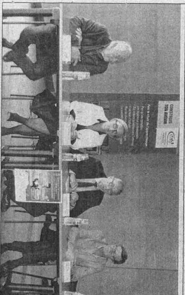
La présentation du 5 e Forum de l'alternance.

Le 5 e Forum de l'alternance en Drôme Nord se tiendra le mercredi 15 juin, de 14 à 17h à la salle des Cordeliers . Une vingtaine d'employeurs sera présente pour recruter.