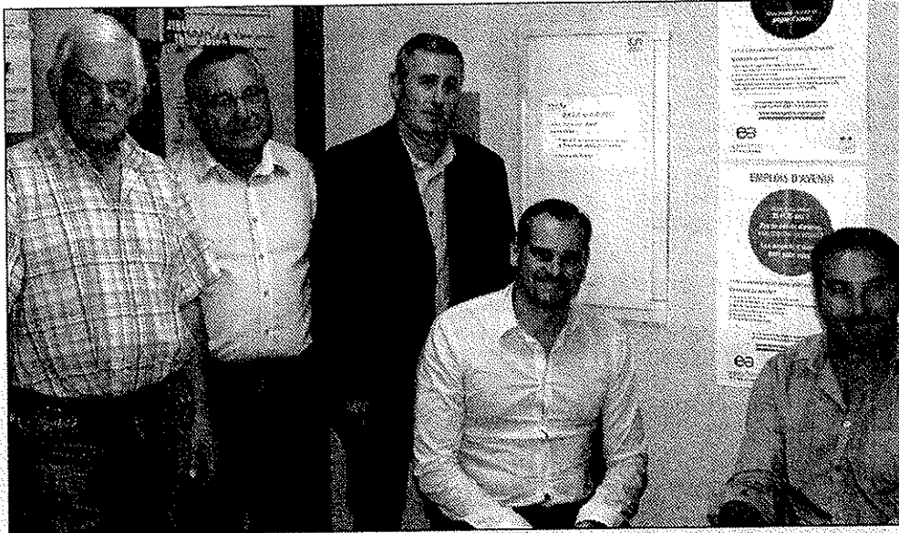
167 contrats d'Avenir ont été signés.