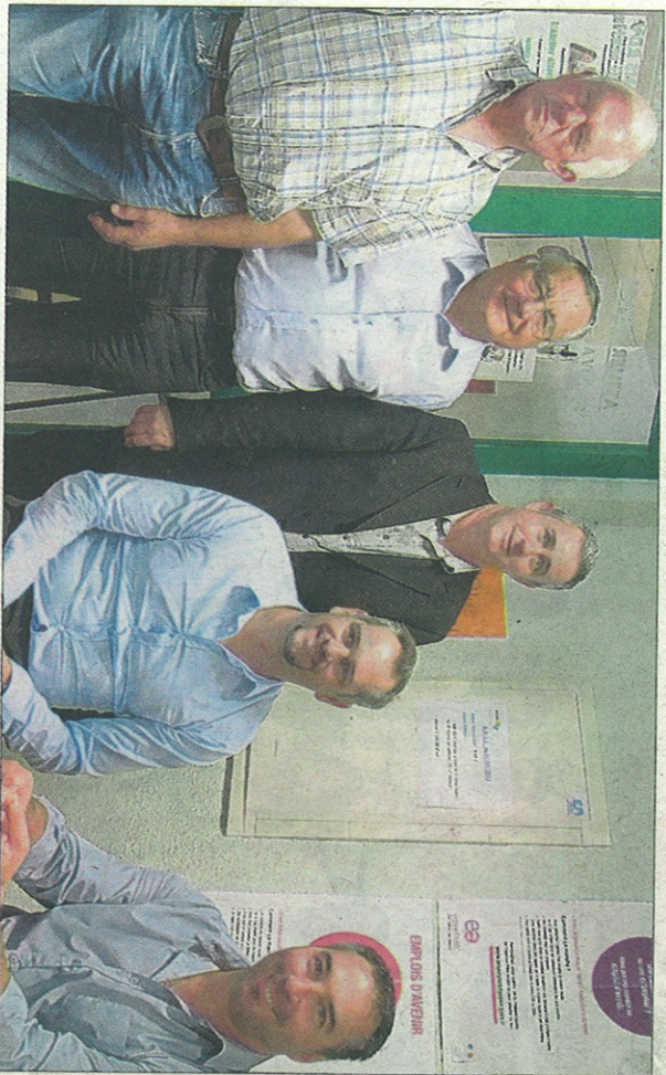
Au 15 septembre, déjà 114 emplois d'avenir ont été passés dans le secteur non-marchand, et 29 dans le monde de l'entreprise. Une dynamique dont se félicitent tous les acteurs de l'emploi des jeunes.

La Drôme a été l'un des tout premiers à se lancer dans le dispositif des Emplois d'avenir. Une tendance dont les effets sont visibles sur la Mission locale de Romans Drôme des collines et du Royans-Vercois.