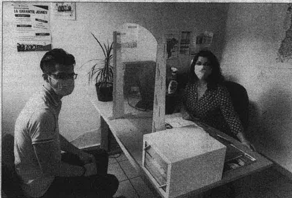
Les conditions de sécurité sont réunies pour le public et le personnel.

Depuis le 2 juin, les jeunes sont de nouveau accueillis physiquement sur les sites de Romans et de Saint-Vallier, ainsi que sur le dispositif de la Garantie Jeunes.