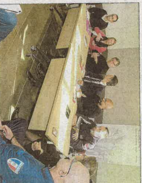
De nombreux métiers seront présentés lors de ce forum qui se déroulera le 18 janvier à l'espace Rochequide.

que les métiers de la défense et de la sécurité nécessitent de la motivation, de la stabilité émotionnelle, de la curiosité intellectuelle, de l'adaptabili- té, le goût du contact humain et un casier judiciaire vier- ge etc. Accompagner les jeu- nes et les moins jeunes vers l'emploi est le principal objec- tif de ce forum, dont l'entrée est libre.