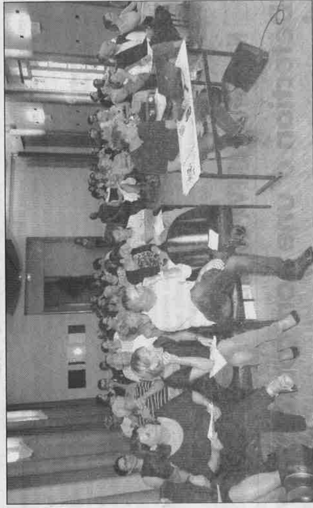
Lors de l'assemblée générale à Romans.