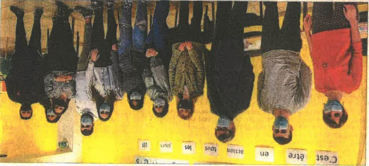
Le plan de relance du gouvernement prévoit une enveloppe supplémentaire pour l'insertion des jeunes dans le cadre de la Garantie jeunes, portée par la mission locale.